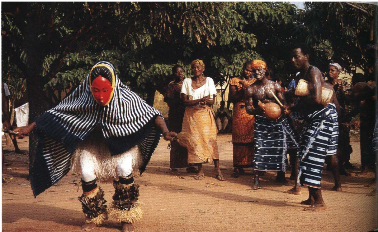
Goli dans Baule, Ivoorkust

heiligdommen opgericht voor de goden van het bos. De onduidelijke en ambivalente identiteit van deze categorie schept verwarring en kan bedreigend zijn. Zo lijken man en vrouw een duidelijk voorbeeld van een binaire oppositie. Maar tegelijk worden man en vrouw steeds weer tot elkaar aangetrokken; slechts hun seksuele verbintenis zorgt voor nageslacht. Mannen beschikken ook over vrouwelijke eigenschappen en omgekeerd. De erkenning dat de binaire oppositie minder exclusief is dan zij lijkt, wordt door de Baule gevisualiseerd in o.a. de zogenaamde goli dans. Deze spectaculaire dans duurt een hele dag en wordt gedanst door vier paren maskers, de kple kple (schijfachtige maskers), de goli glen (dierenmaskers in de vorm van een helm), kpan pie (gezichtsmaskers met hoorns) en kpan (maskers met haardracht). Omdat de goli dans geen religieuze (‘heidense’) connotaties bezit en voor velen slechts amusementswaarde heeft, mag hij ook door (orthodoxe) christenen worden bijgewoond. Dit, tezamen met het feit dat deze dans jarenlang op Televisie is gepresenteerd als ‘authentieke’ dans van Ivoorkust, heeft de goli bijzonder populair gemaakt in binnen- en buitenland.