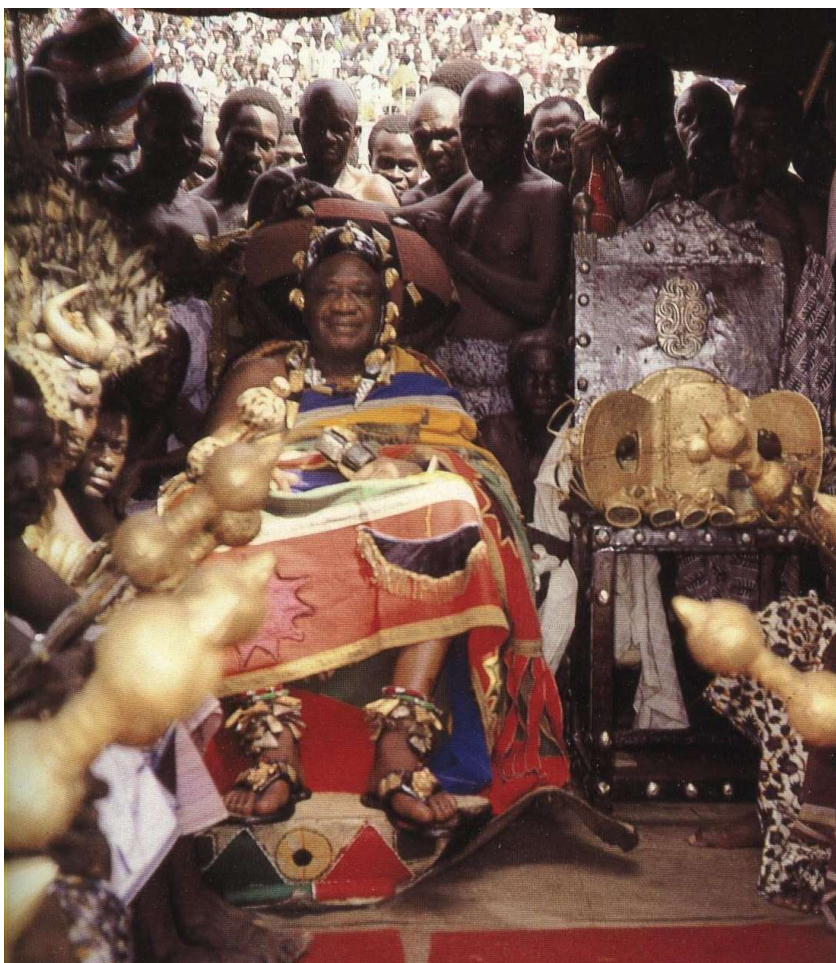
De Ashantehene Otomfuo Opoku Ware II, op het Odwira Festival van Kumasi, Ghana 1985

De koningen van Benin hebben al vanaf de 14 de eeuw de beste bronsgieters en ivoorsnijders uit het land aan zich weten te binden. Hun kunstwerken getuigen van de macht en rijkdom van de Oba (Koning) van Benin. (Willett, 2002, 76,96-101,165-166).