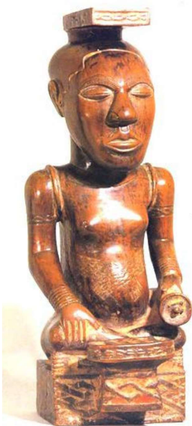
Koningsbeeld Kuba Congo British museum, Londen.

De premoderne samenleving bestaat niet alleen uit de nu levende mensen, maar ook en vooral uit de mensen die hen zijn voorgegaan: de voorouders.