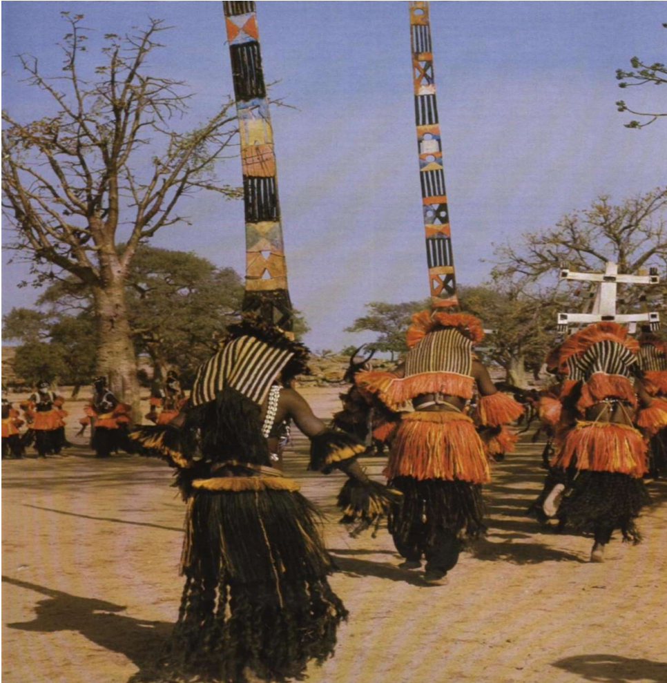
Maskerfeesten (Dama) bij begrafenis bij Dogon, Mali. ( W. Van Beek)

Vooral bij de Dogon in Mali zijn zulke maskerfeesten ( dama ) uitgegroeid tot dagen durende spektakels die ook veel toeristen trekken (Van Beek, 2000).