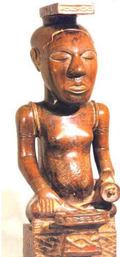
Koningsbeeld Kuba Congo British museum, Londen.

De premoderne samenleving bestaat niet alleen uit de nu levende mensen, maar ook en vooral uit de mensen die hen zijn voorgegaan: de voorouders.