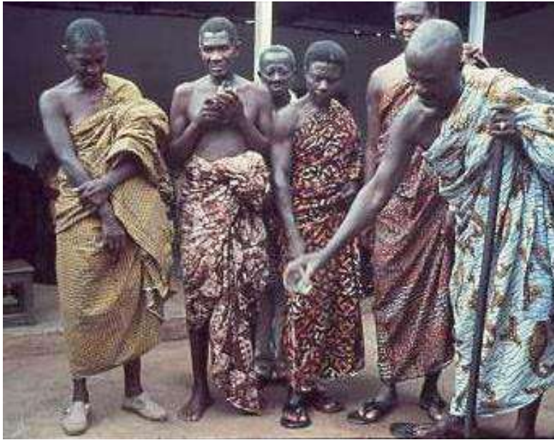
Een raadsheer van de Chieft plengt voor de voorouders in Ashanti Ghana 1967

opgeroepen worden om aanwezig te komen in door mensen gemaakte voorwerpen zoals krachtbeelden (in Congo de bekende Nkisi beelden, soms spijkerbeelden genoemd. (Willett, 2002, 187, 227). De mens is zich bewust dat zijn lot in de handen van deze bovennatuurlijke (antropomorf voorgestelde) krachten ligt. Zij kunnen hem of zijn dierbaren ziek of armlastig maken, zijn vee doden, maar hem ook voorspoed en rijkdom, maatschappelijk aanzien of politieke macht geven. Voor de mens is het daarom een dagelijkse zorg de kwade krachten te neutraliseren of tot andere gedachten te brengen en de goede krachten aan zijn kant te krijgen en te houden.