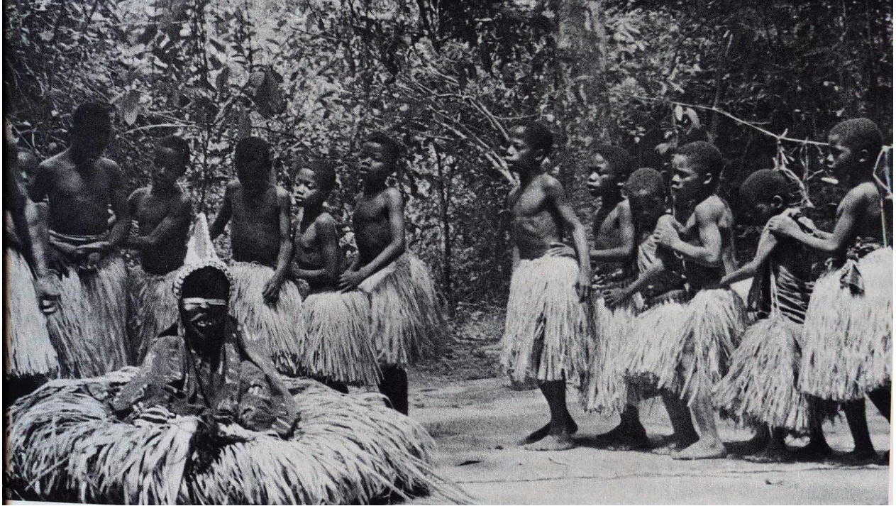
De dansleraar met zijn jongens in een besnijdeniskamp van Nyor Diaple

Bij de Dan van Ivoorkust verblijven de initiandi ongeveer zeven weken in het besnijdeniskamp. Een belangrijke rol in de organisatie van het kamp is gereserveerd voor het masker De-angle , ook wel Mandorple genoemd. Dit masker trekt samen met het masker Ble laat in de middag, als de vrouwen in het dorp bezig zijn met de bereiding van de avondmaaltijd, vanuit het kamp naar het dorp om voedsel te verzamelen voor de initiandi. Deze maskers dansen of zingen niet en worden niet begeleid door muzikanten. Zij gaan de binnenplaatsen op waar de vrouwen staan te koken en vragen met humor en plagerijen om voedsel, dat door de vrouwen graag gegeven wordt, omdat zij weten dat het voor hun kinderen is. De antropoloog Hans Himmelheber heeft zeven weken lang iedere dag een dergelijk kamp bezocht en er een dagboek van bijgehouden. (Himmelheber. 1979)