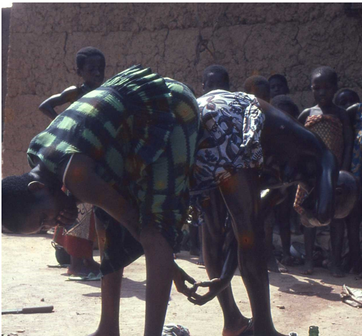
Meisje (rechts) krijgt hard gekookt ei van een vriendin: Sefwi, Ghana.

Bij de Akan-sprekende volken van Ghana en Ivoorkust (waaronder Ashanti en Fanti) bestaat geen besnijdenis van meisjes. Toch bestaan er puberteitsriten. Wanneer de familie besloten heeft dat hun dochter huwbaar is (dit kan dus enkele jaren na de eerste menstruatie zijn), worden voorbereidingen getroffen voor het heugelijke moment. Dit houdt in dat de familie voldoende voedsel verzamelt voor het feest en dat er gouden sieraden,