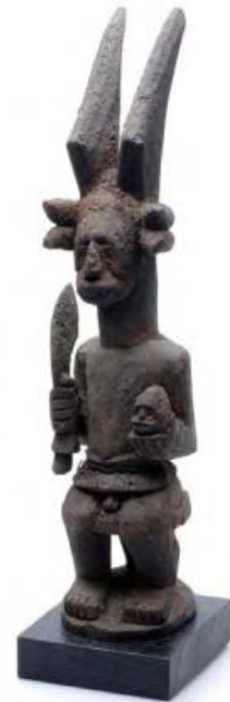
Ikenga beeld

De Igbo van Nigeria kennen geen puberteitsriten voor jongens in groepsverband. Wanneer vroeger een familie besloot dat hun zoon oud genoeg was om een gezin te stichten en een huis te bouwen, werd hem dat meegedeeld. De jongen wist dan wat hem te doen stond. Hij zou op een avond, gekleed in een raffiarok (de dracht van de krijger) en gewapend met een machete, het dorp verlaten met de bedoeling om een man van een ander dorp te doden en met het afgehouden hoofd terug te keren in zijn dorp. Hij werd met gejuich ontvangen als een huwbare, volwassen man. De jonge vrouwen dongen naar zijn hand. Hij begon met het bouwen van zijn huis. Zodra de kamer voor het huisaltaar gereed was, liet hij een beeld maken van de prestatie die hij had geleverd. Dit beeld heette: ikenga , letterlijk de kracht van mijn rechterhand. Het beeld stelde een krijger in raffia rok voor, met een machete in zijn rechterhand en een afgehouden hoofd in zijn linker. Op het hoofd prijkten twee indrukwekkende ramshoorns. Tegelijk zat de krijger op een zetel, het voorrecht van de 'gezetten burger': hij was nu immers een volwassen man met recht van spreken.